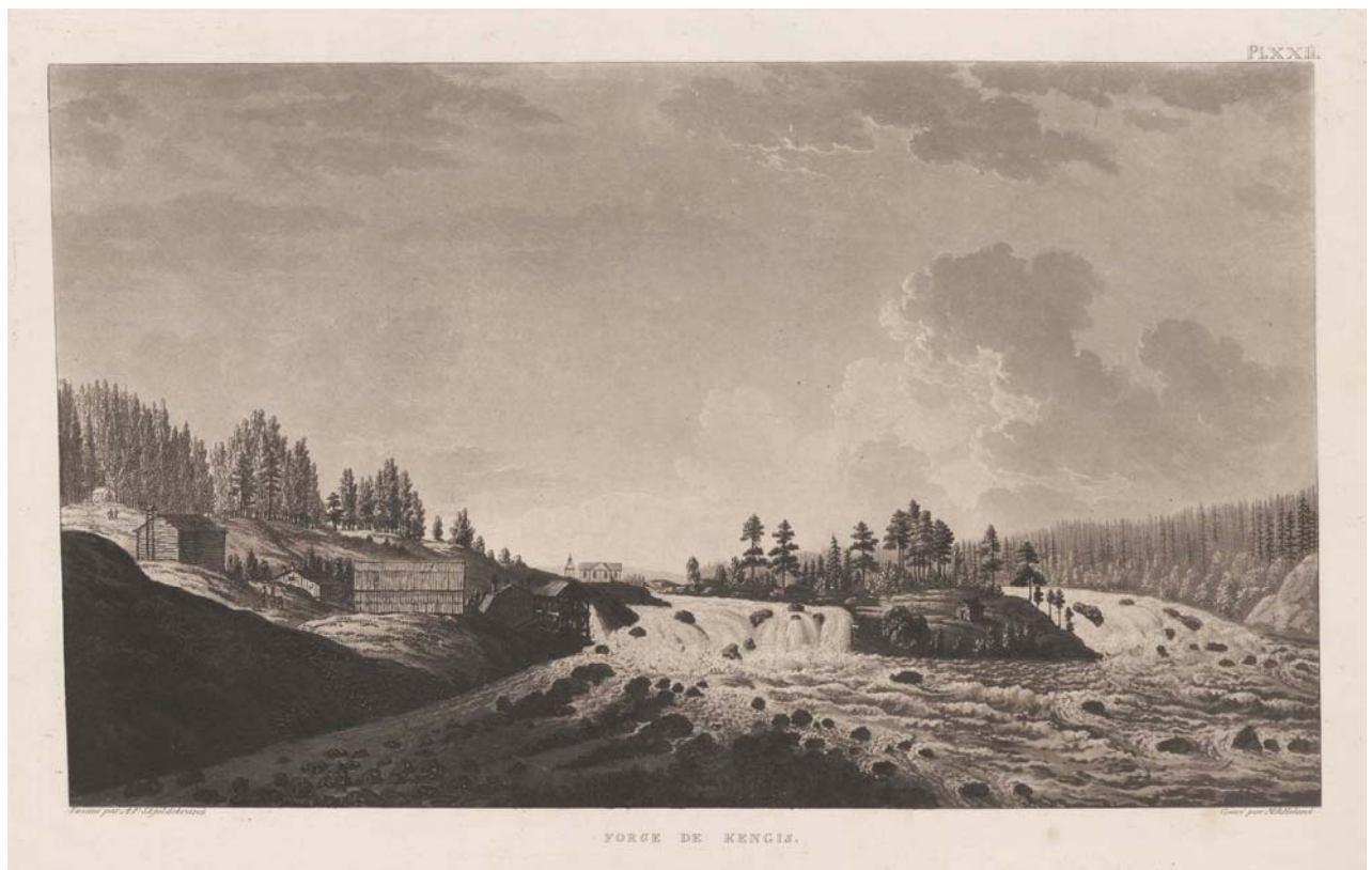
Kengis fors och kyrka ca 1801 litografi av Skjöldebrand.